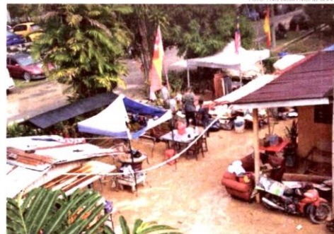
Keadaan banjir kilat yang melanda Bukit Belacan pada Isnin.

Menurutnya, penduduk terkejut apabila paras air mencecah 1.2 meter menyebabkan beberapa