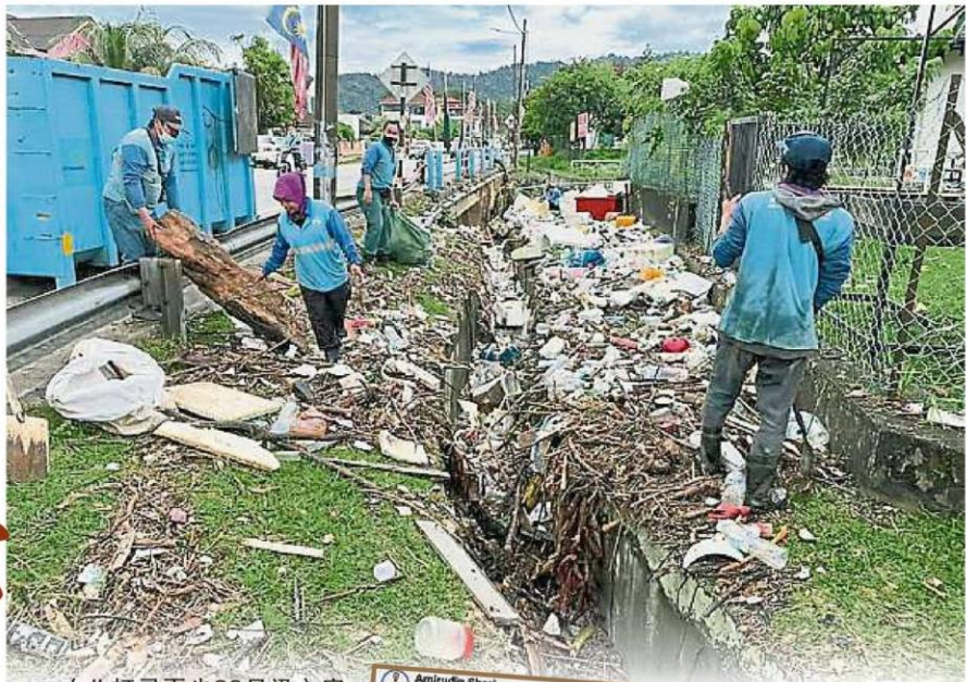
大量垃圾。 安邦再也市议会固体废物管理组及公共清洁组，清除沟渠内及周围的

(八打灵再也23日讯)安邦大水灾，垃圾是首祸？ 安邦昨日傍晚6时许迎来一场狂风暴雨，导致数个马来甘榜引发闪电水灾，水位高涨达1公尺。