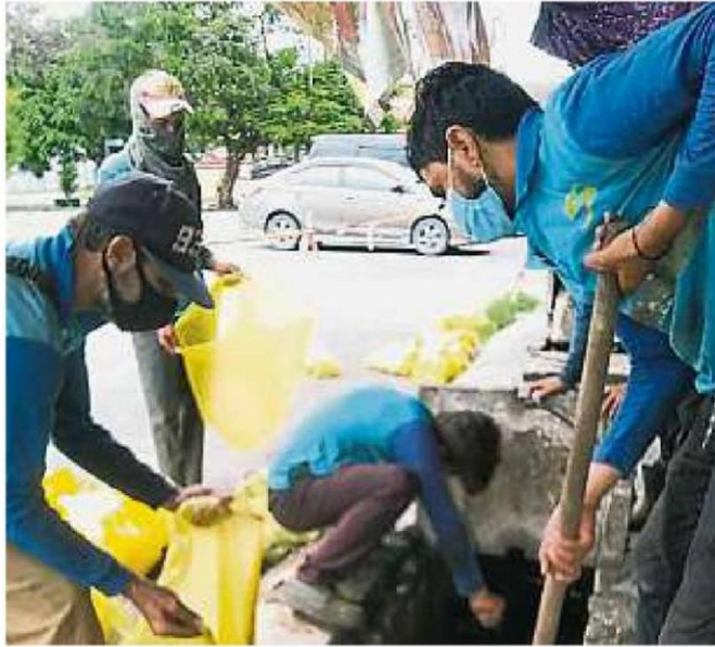
瓜冷市议会及达鲁益善固体废物管理公司员工，清理阻塞的沟渠。