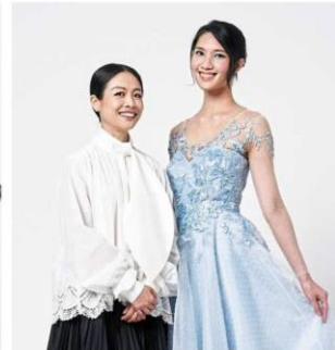
Thoi believes in Cinderella's brave spirit and positive attitude.