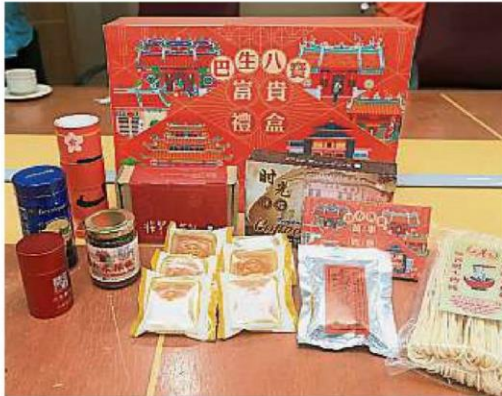
巴生八宝富贵礼盒由巴生8种食品组成，包括旺来黄梨酥、甜蜜巧克力、健康肉骨茶、长寿好面线、平安清凉茶、吉祥香佛手、美满虾米酱及幸福黑咖啡；每盒售价为168令吉，限量发售1000盒。