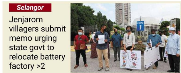
Selangor Jenjarom villagers submit memo urging state govt to relocate battery factory >2

By FARID WAHAB faridwahab@thestar.com.my