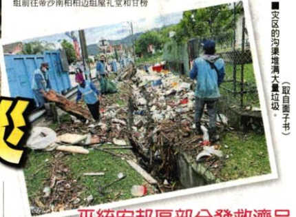
■灾区的沟渠堆满大量垃圾。

災黎被緊急疏散 由于水灾影响范围甚大，安邦再也市议会和雪州消防局立即前往灾区救援，灾黎被紧急疏散到临时收容中心。 安邦再也市议会面子书发布救灾的帖文，市议会的青年、社会与园艺组前往帝沙南柏柏边祖屋礼堂和甘榜