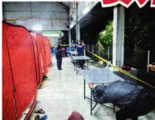
■鉴于灾情严重，当局设立临时收容中心安顿灾黎。

報導 ● 劉佩明 (安邦23日讯) 由于昨晚降雨量太高，安邦多区发生严重水灾，其中甘榜南柏柏再北区和南区水位接近一公尺，估计近500户家庭受影响！ 昨晚(22日)6时，乌冷一带下起长命豪雨，许多灾黎纷纷在社交网站发布水灾的照片和视频。 当时灾区情况相当严重，水位已经达到成年人的腰部，道路完全不能行驶，多辆没有被移走的汽车皆浸泡在水中。