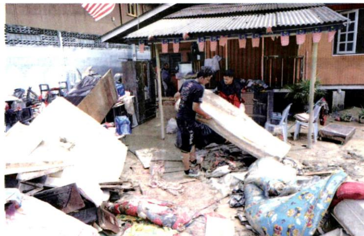
MANGSA terpaksa membuang barangan yang rosak akibat banjir di Kampung Lembah Jaya, Ampang.

"Majlis Perbandaran Ampang Jaya (MPAJ) turut bertanggungjawab memastikan kerja-kerja pembaikan dilakukan segera dan menyemak sama ada berlaku kecuaihan daripada pihak terbahit dan sebagainya," katanya semasa melawat mangsa banjir di Dewan MPAJ, Lembah Permai di sini semalam.