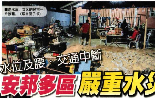
■遇水后，灾区的民宅一片狼藉。

災黎被緊急疏散 由于水灾影响范围甚大，安邦再也市议会和雪州消防局立即前往灾区救援，灾黎被紧急疏散到临时收容中心。 安邦再也市议会面子书发布救灾的帖文，市议会的青年、社会与园艺组前往帝沙南柏柏边祖屋礼堂和甘榜