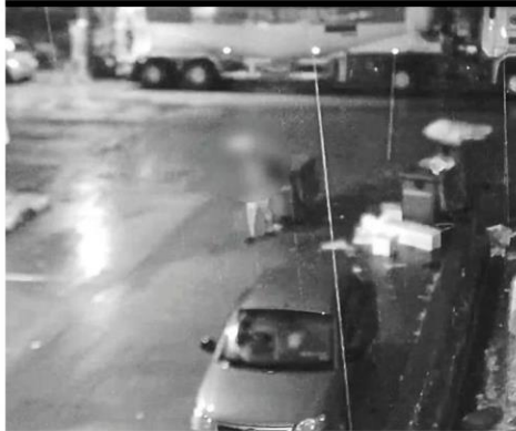
The individual (image blurred out, centre) caught on CCTV stealing a council-owned rubbish bin.