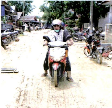
PENDUDUK melalui jalan yang berlumpur akibat kejadian banjir di Kampung Lembah Jaya, Ampang, kelmarin.