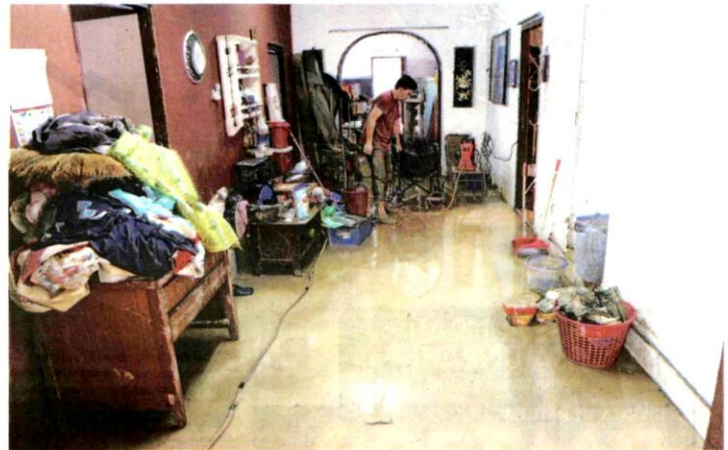
KEADAAN dalam sebuah rumah mangsa banjir dipenuhi lumpur.

Sebanyak 50 mangsa daripada 17 keluarga dipindahkan ke pusat pemindahan