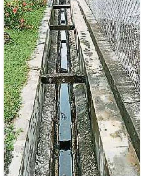
仁嘉隆第14巷沟渠清理后，水流通畅无阻。