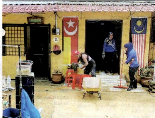
DUA sukarelawan membantu membersihkan rumah penduduk di Kampung Lembah Jaya Utara, Ampang semalam.